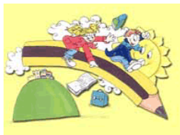
ISC PETRITOLI Rete di scuole per l'Intercultura